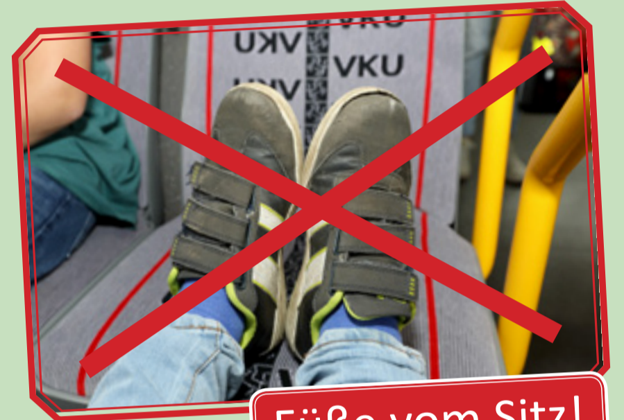
Füße vom Sitz!