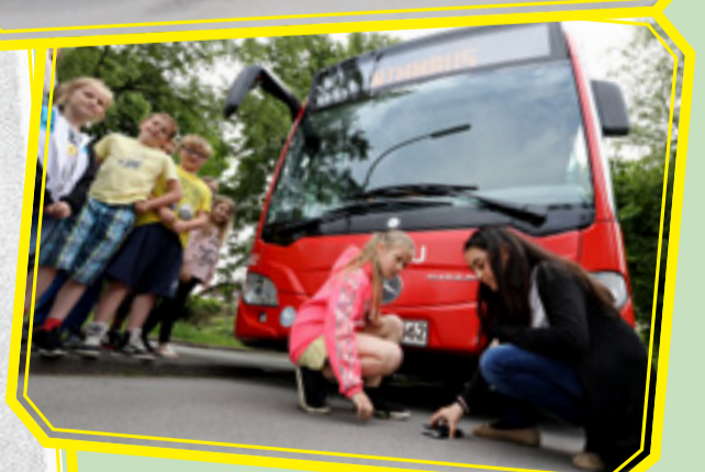
Vorsicht! Toter Winkel!