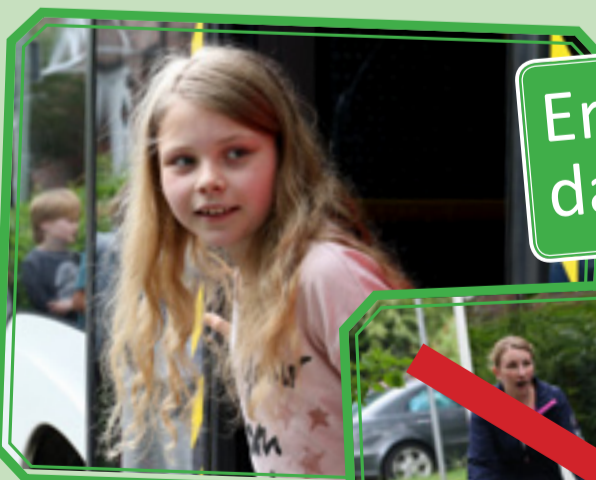
Erst schauen dann gehen!