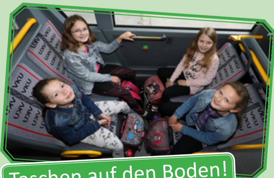
Taschen auf den Boden!